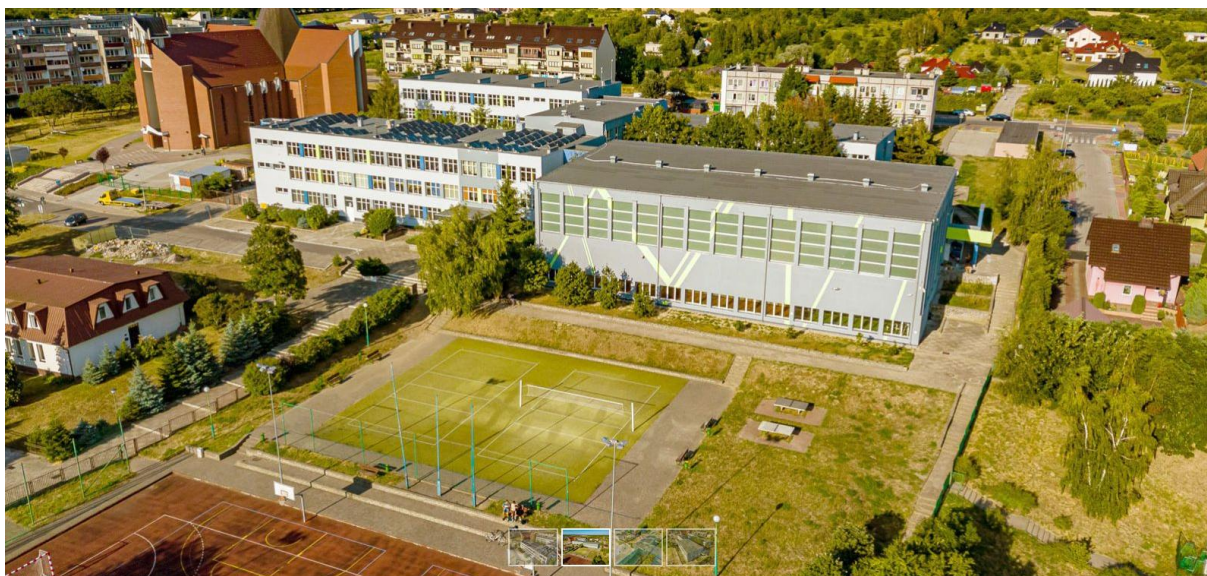
Szkoła Podstawowa Nr 3 im. Noblistów Polskich w Gryfinie