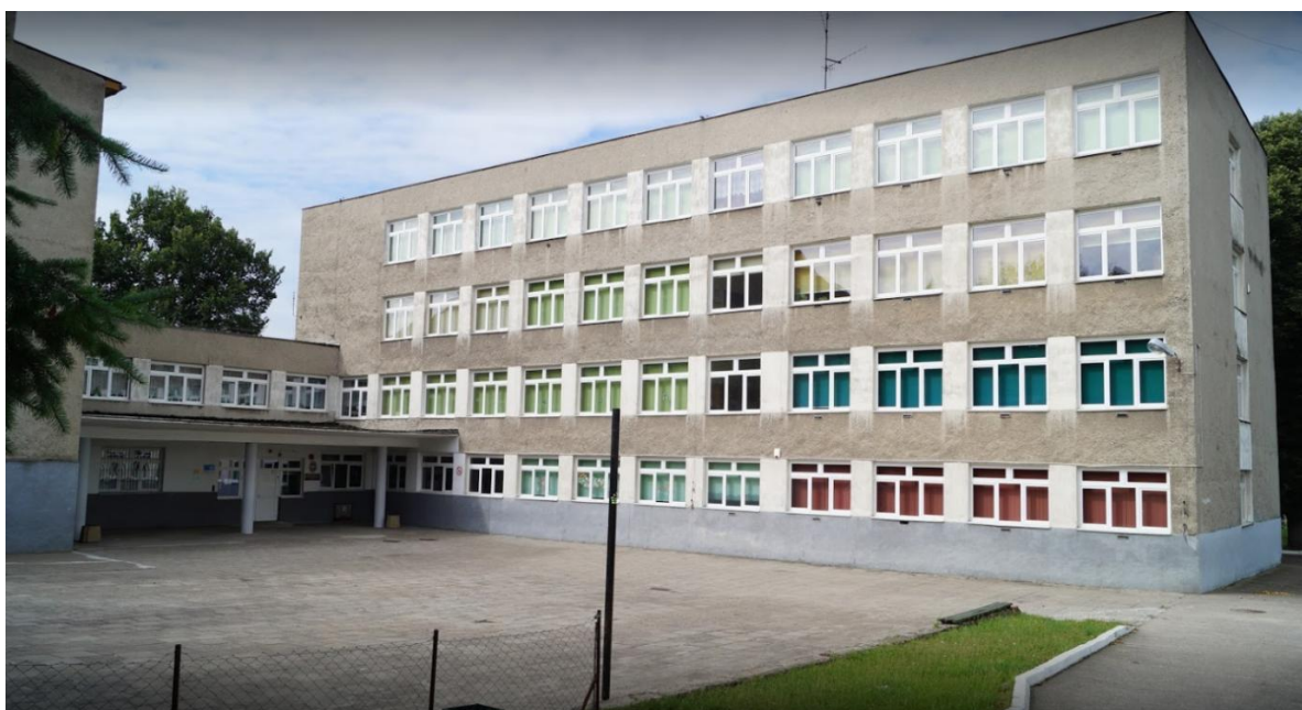
Szkoła Podstawowa Nr 1 z Oddziałami Integracyjnymi im. Marii Dąbrowskiej w Gryfinie