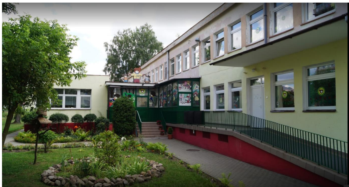
Przedszkole Nr 2 im. Misia Uszatka w Gryfinie