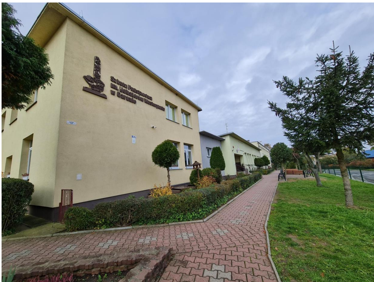
Szkoła Podstawowa im. Bohaterów Westerplatte w Gardnie