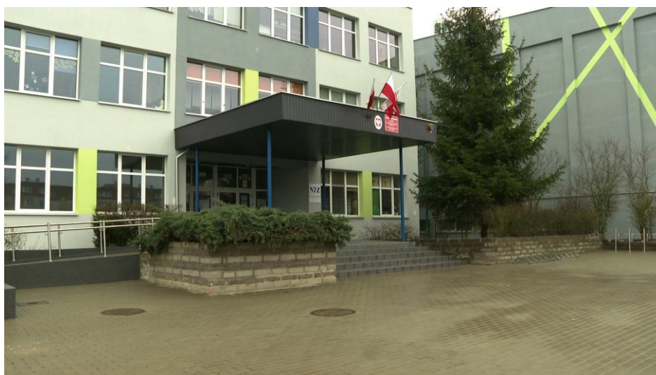
Szkoła Podstawowa Nr 3 im. Noblistów Polskich w Gryfinie