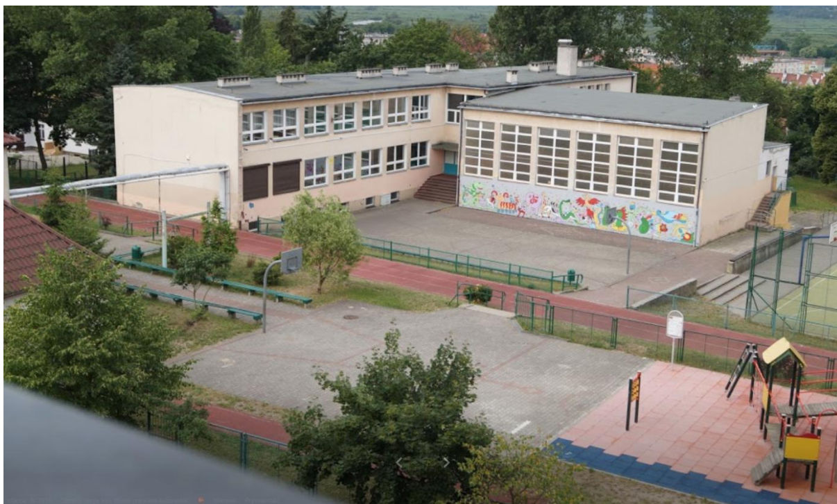
Szkoła Podstawowa Nr 2 im. kpt. ż. w. Mamerta Stankiewicza w Gryfinie