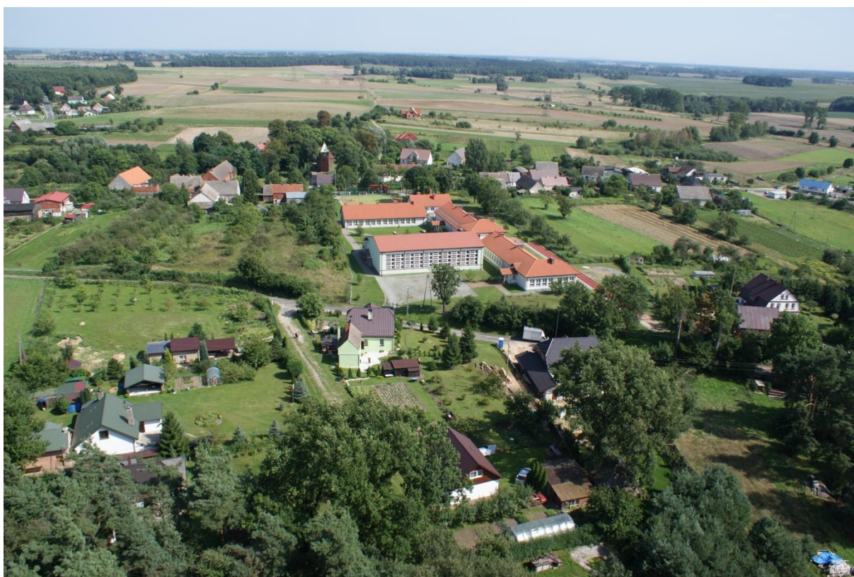
Szkoła Podstawowa im. Jana Pawła II w Chwarstnicy