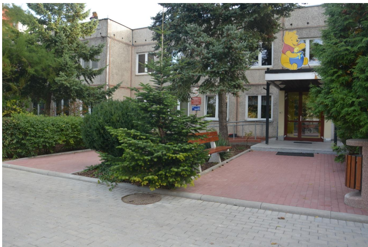
Przedszkole Nr 3 im. Kubusia Puchatka w Gryfinie