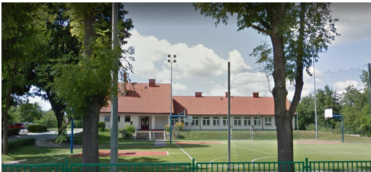
Szkoła Podstawowa im. Jana Pawła II w Chwarstnicy