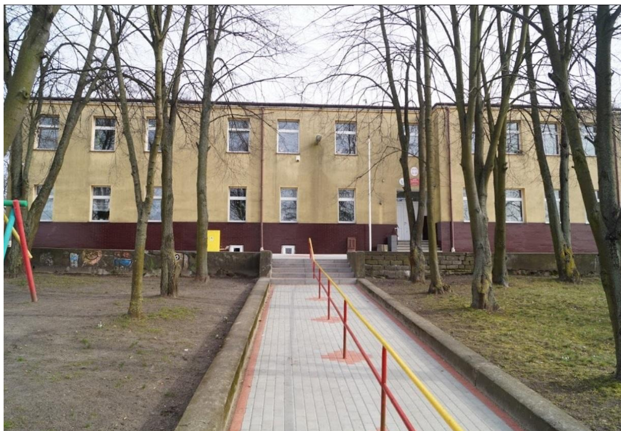
Szkoła Podstawowa im. Małych Zesańców Sybiru w Radziszewie