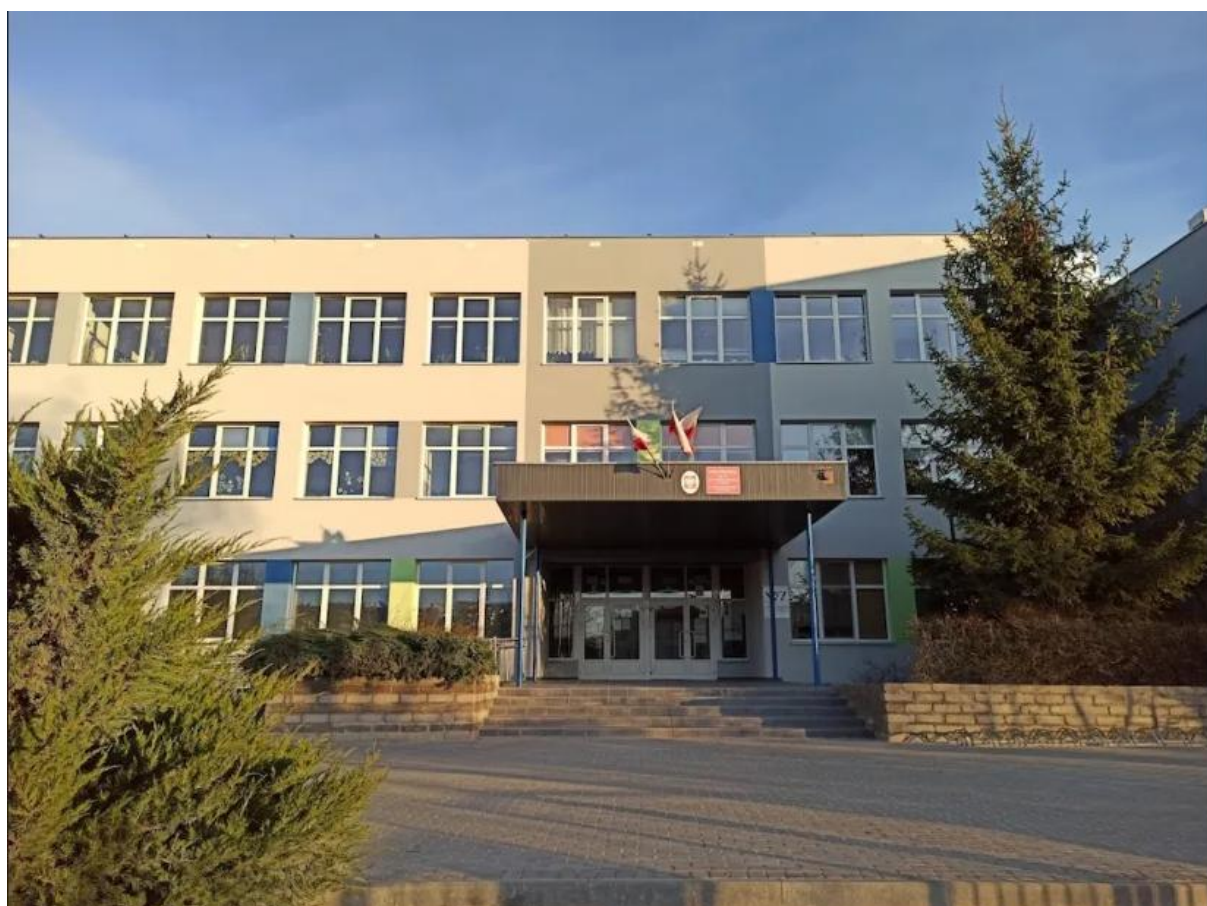
Szkoła Podstawowa Nr 3 im. Noblistów Polskich w Gryfinie