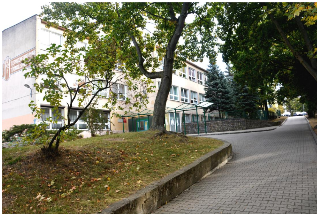
Szkoła Podstawowa Nr 2 im. kpt. ż. w. Mamerta Stankiewicza w Gryfinie