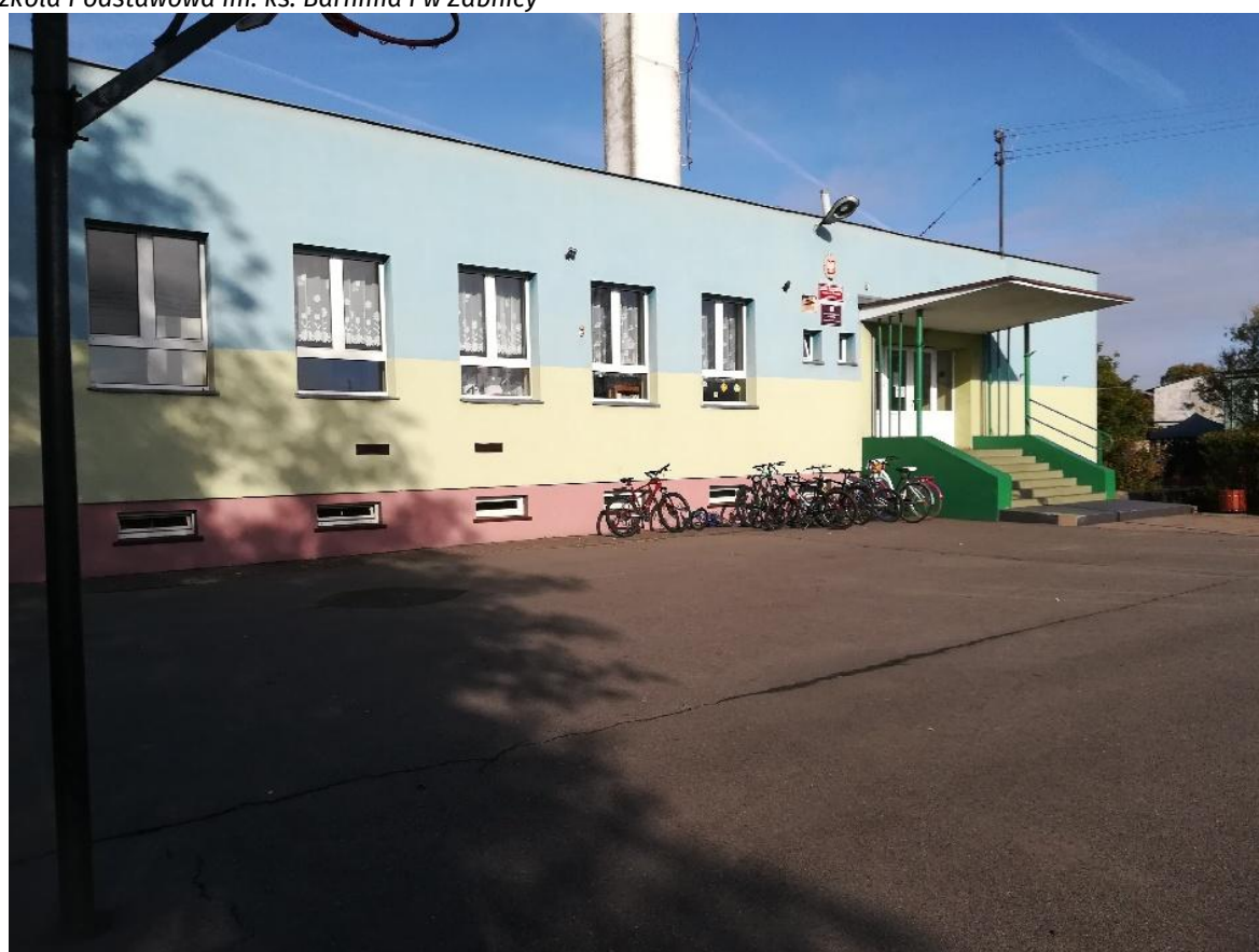
Szkoła Podstawowa im. ks. Barnima I w Żabnicy