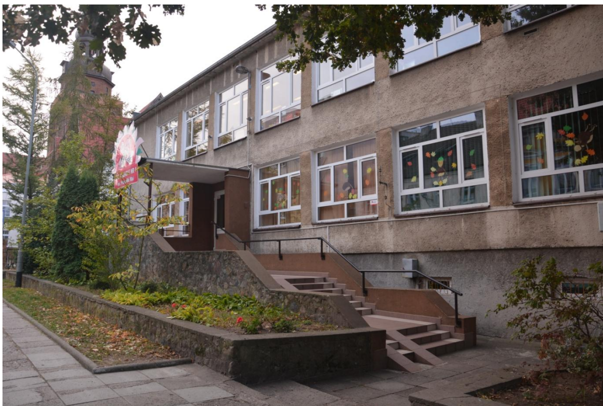
Przedszkole Nr 4 z Oddziałami Integracyjnymi im. Pszczółki Mai w Gryfinie