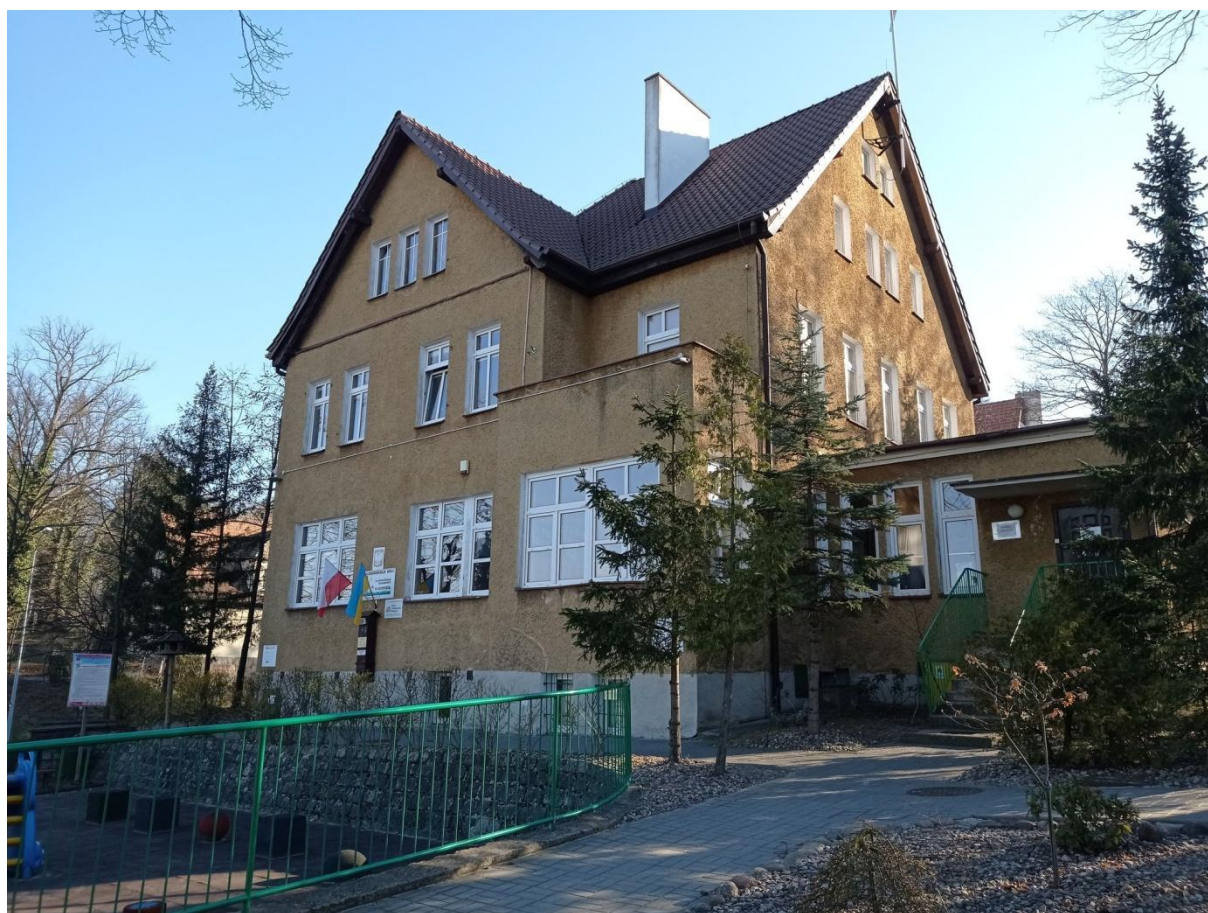
Przedszkole Nr 1 im. Krasnala Hałabały w Gryfinie