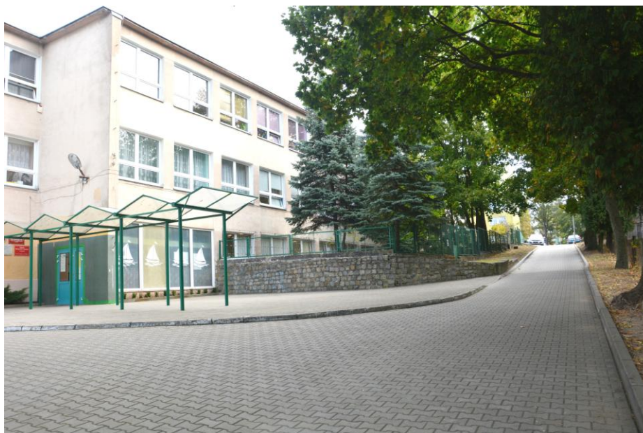
Szkoła Podstawowa Nr 2 im. kpt. ż. w. Mamerta Stankiewicza w Gryfinie