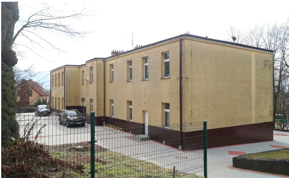
Szkoła Podstawowa im. Małych Zesłańców Sybiru w Radziszewie