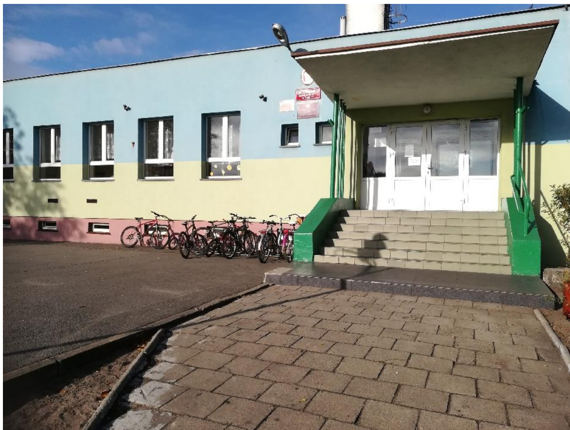
Szkoła Podstawowa im. ks. Barnima I w Żabnicy