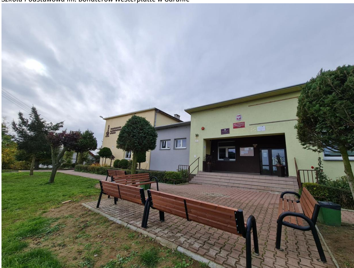
Szkoła Podstawowa im. Bohaterów Westerplatte w Gardnie