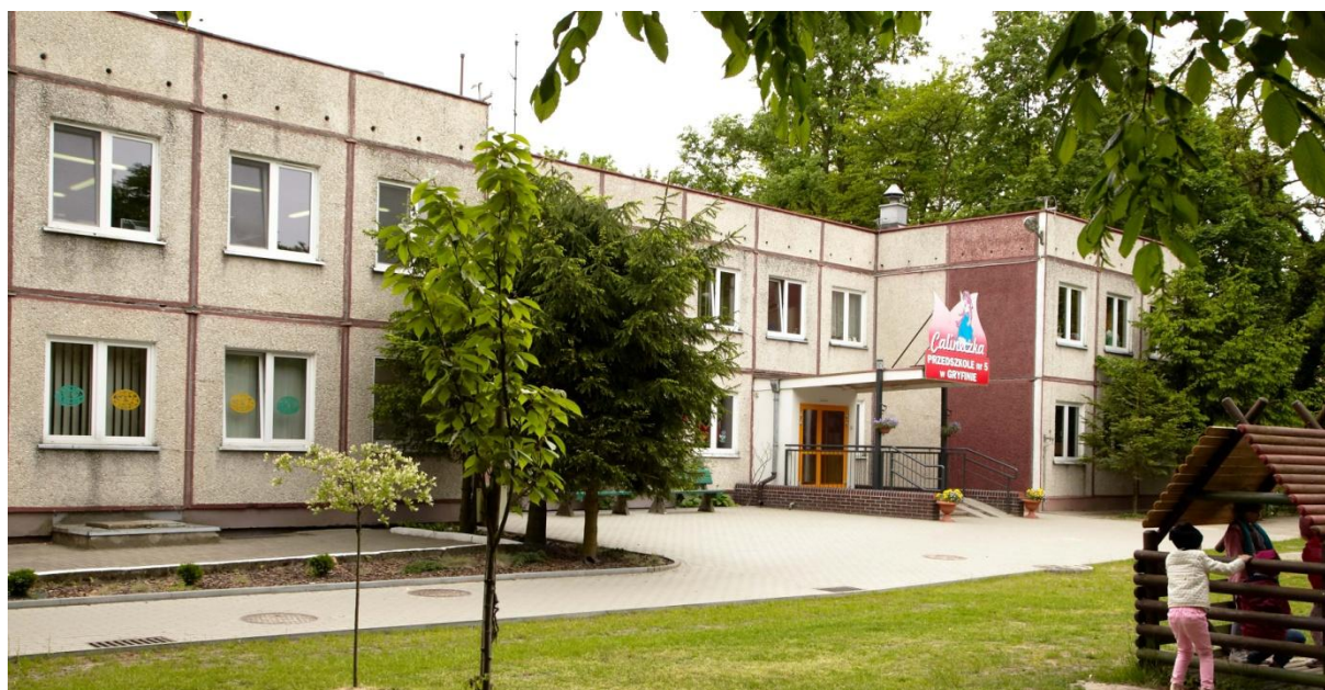
Przedszkole Nr 5 im. Calineczki w Gryfinie