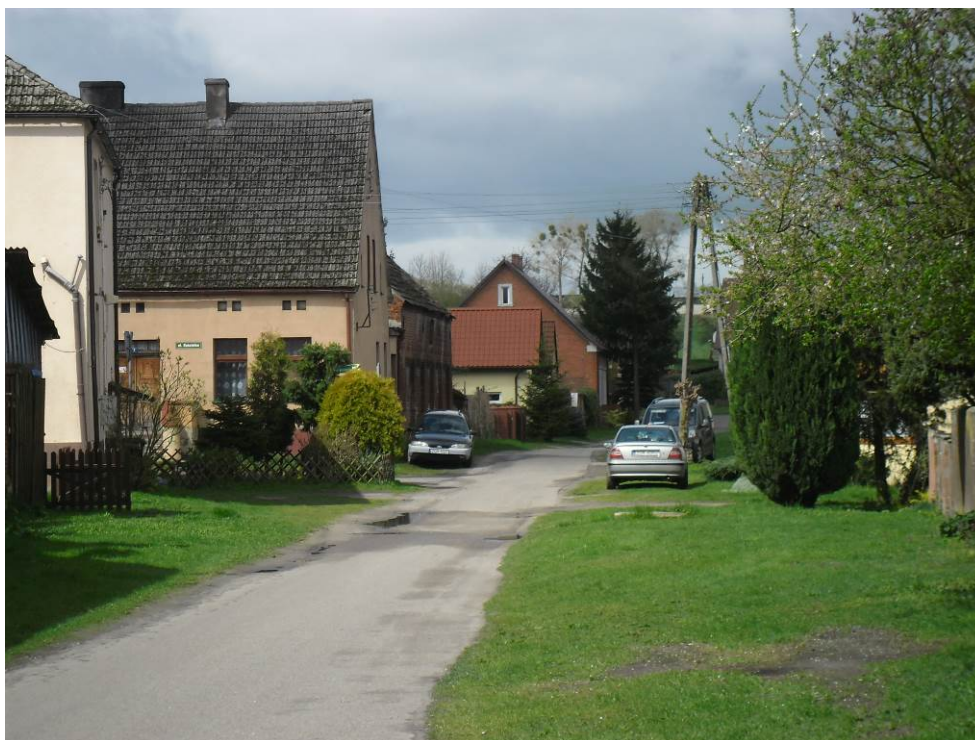
Zdjęcie. Układ ulic i zabudowań we wsi Wełtyń.