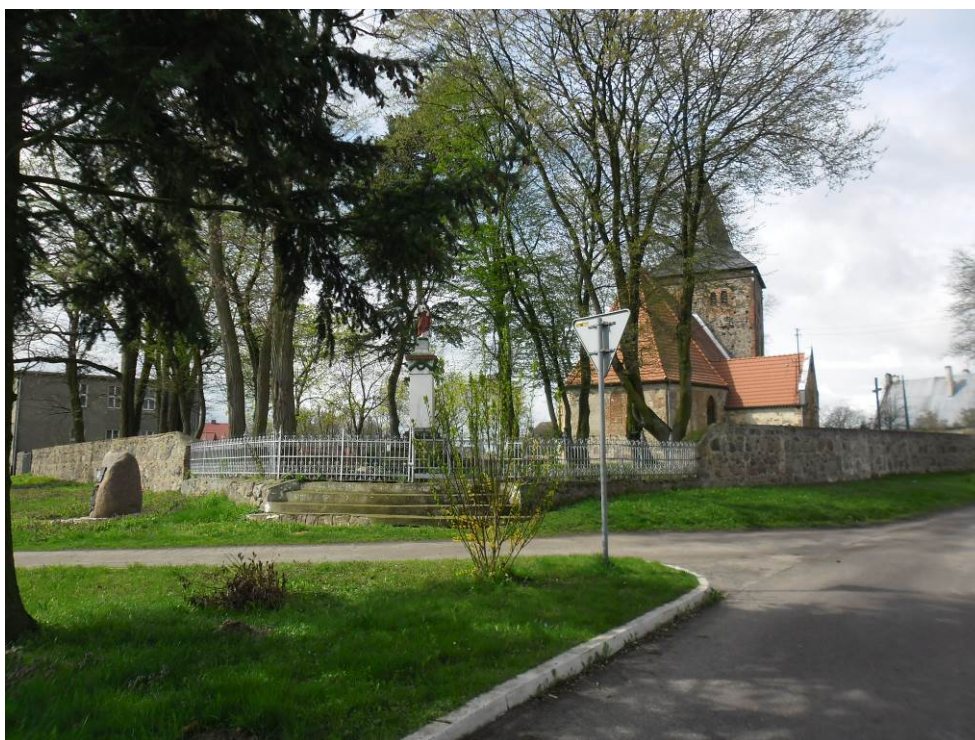
Zdjęcie. Kościół Matki Boskiej Różańcowej w Wełtyniu.