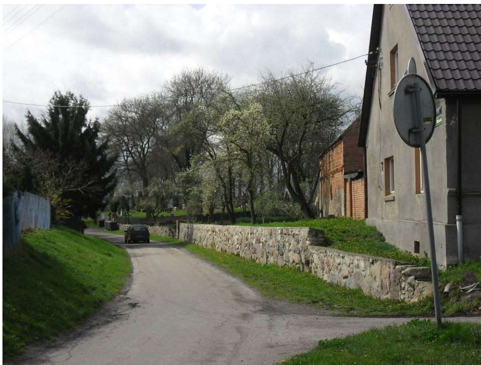
Zdjęcie. Układ ulic i zabudowań we wsi Wełtyń.

Tereny objęte ochroną nieprzerwanie utrzymują walory przyrodnicze i kulturowe, które stanowią o atrakcyjności, tego wyjątkowego obszaru Gminy Gryfino, bez wątpienia jest to argument za tym, by nadać temu obszarowi status zespołu przyrodniczo-krajobrazowego, co pozwoli na utrzymanie tych walorów.