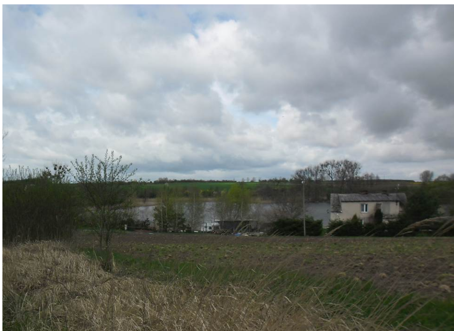
Zdjęcie. Malowniczy układ pagórków i jeziora Zamkowego na wjeździe od strony Gardna.

charakter nieuporządkowanego, pozostającego w nieładzie i dysharmonii z zastanym wcześniej zagospodarowaniem. Obecnie w obrębie miejscowości harmonijny układ krajobrazowy jest zachowany.