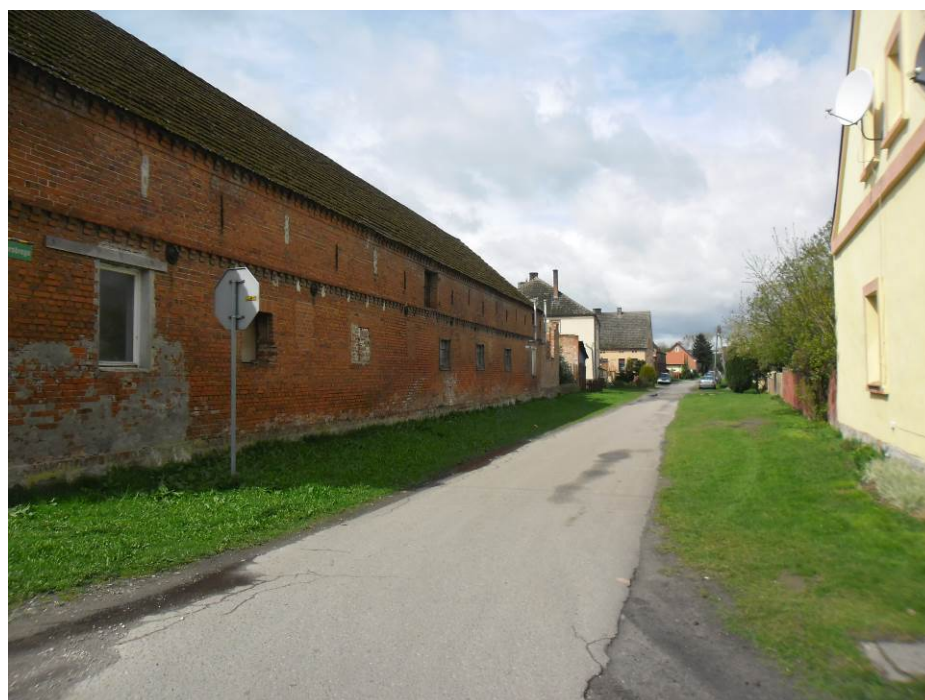
Zdjęcie. Układ ulic i zabudowań we wsi Weltyń.