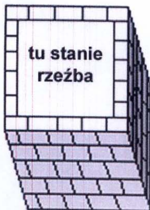
Widok-rzut z góry - podest